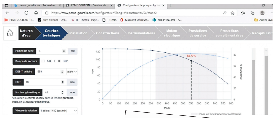
Ci-dessus : Capture d'écran lors de la phase 2 de la configuration

Depuis une petite dizaine d'années, plusieurs constructeurs de pompes ont lancé, soit après un développement propre, soit par customisation de logiciels existants, un configurateur de pompes plus ou moins bien adapté à leur gamme, plus ou moins détaillé. La société Peme Gourdin a choisi elle, de lancer d'emblée un configurateur très détaillé, mais aussi très convivial, en s'inspirant de ceux proposés par les constructeurs automobiles, c'est-à-dire aboutissant à la possibilité de disposer instantanément d'une offre technique et de recevoir sous 48H une offre commerciale correspondant à la configuration réalisée. Pour réaliser son configurateur, Peme Gourdin est parti d'une page blanche avec une société de développement informatique, ce qui